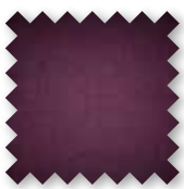
Kleur van de nieuwe sofa**