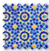
Het Portugese straatje**